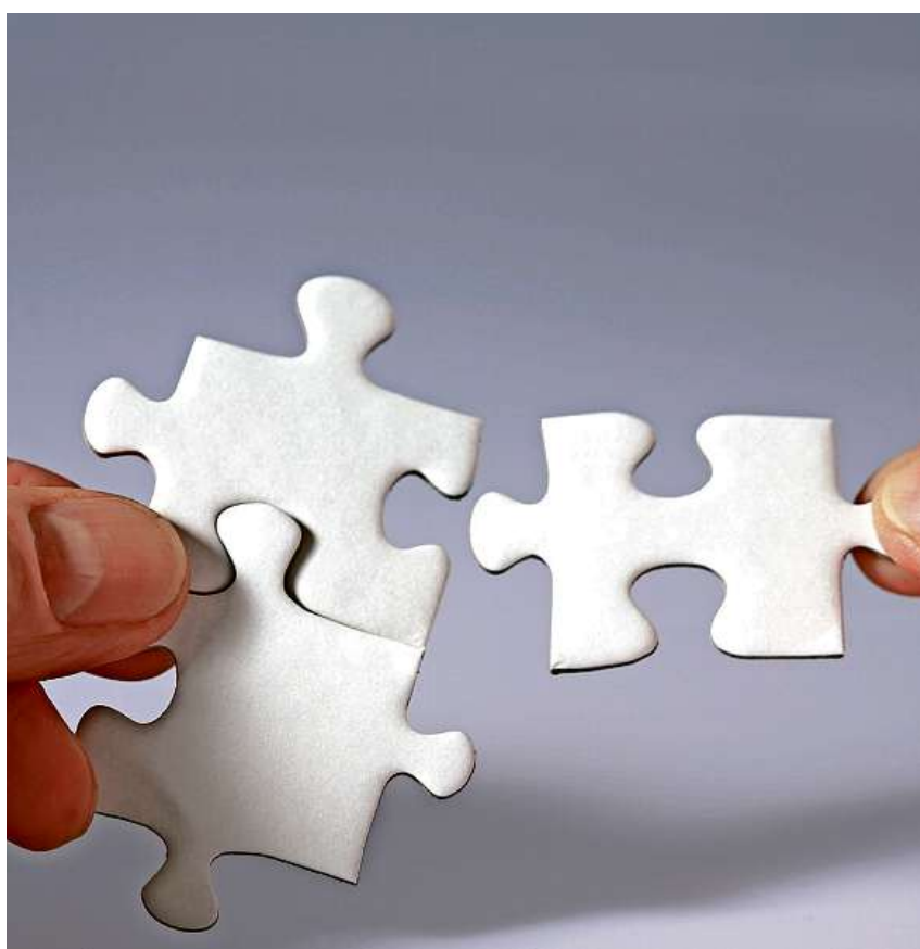
Kranken, verunfallten oder handicapierten Menschen bei der beruflichen Wiedereingliederung helfen – mit einem neuen Instrument.

Als Basis des REP halten die Arbeitgeber online die Arbeitsplatzanforderun-